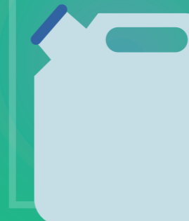
Jerrican en plastique