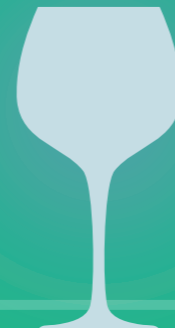
Verre de vin