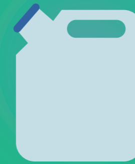
Jerrican en plastique