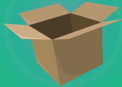
Boîte en carton