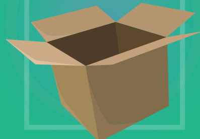
Boîte en carton